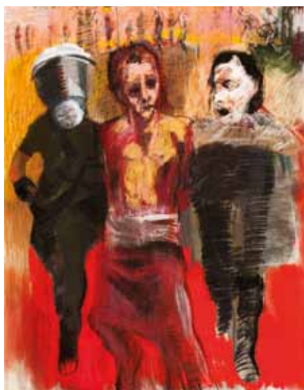
Graça Morais, "A Caminhada do Medo VIII"

Foi sob o efeito das fotografias publicadas em jornais e em revistas que os desenhos foram realizados. O uso dos recortes de jornais que ainda hoje subsiste vem da infância e da juventude, vem da tradição popular de forrar prateleiras com jornais decorativamente recortados, em padrões geométricos básicos, e do hábito de os ler nessa circunstância. O gosto pela utilização dos jornais manter-se-ia, não apenas nesse registo ornamental, mas como fonte insubstituível de imagens e como uma das