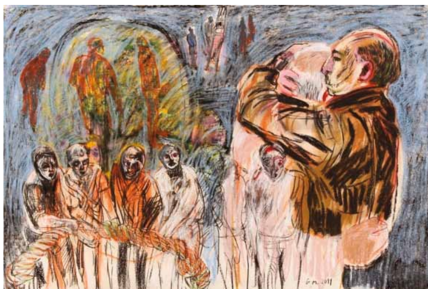
Graça Morais, "A Caminhada do Medo VIII"