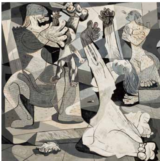
Candido Portinari - A Justiça de Salomão

No contexto da actual crise, em que a governança da Europa é decidida no eixo franco-alemão, importa começar por recordar que a palavra greve tem origem francesa, tendo surgido junto a Paris, no final do Século XVIII. Em Portugal parece consensual que a primeira greve ocorreu na indústria, em meados do Século XIX, por iniciativa dos operários de fundição e serralharia.