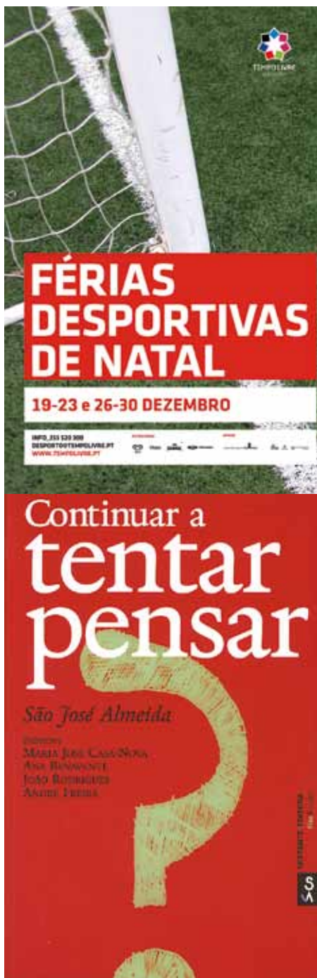
Férias desportivas em Guimarães